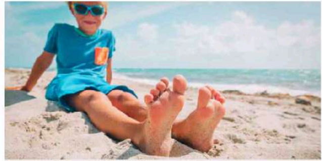
Los pies cavos suelen desarrollarse entre los 8 y los 12 años.