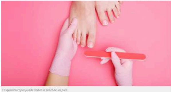
La quimioterapia puede dañar la salud de los pies.

Actualizado a: Martes, 19 Octubre, 2021 11:42:58