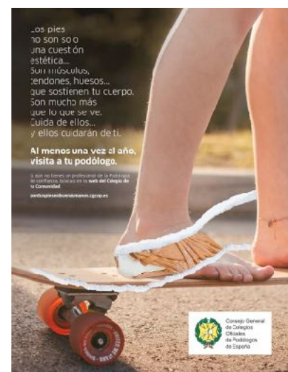
Los tres anuncios de la campaña